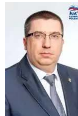
Председатель Думы СЫСОЕВ АЛЕКСЕЙ НИКОЛАЕВИЧ ДЕПУТАТЫ 7 СОЗЫВА